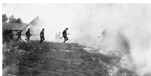
Canadezen gaan onder bescherming van een rookgordijn ten aanval in de Slag bij Mount Sorrel.

In allerijl worden Canadese versterkingen naar het front gestuurd. Na een hele nacht marcheren wordt een haastig ineen geflanste tegenaanval uitgevoerd. Aan de startposities heerst verwarring. Aarzelend zetten de Canadese bataljons één voor één de aanval in, niet wetend of de mannen naast hen wel kunnen volgen. Het is intussen volop daglicht. Het vuur is moordend. Slechts kleine groepjes weten de Duitse linies te bereiken. De Canadezen slagen er niet in om de hoogtes te heroveren, maar kunnen zich wel ingraven aan de voet van de heuvelrug.