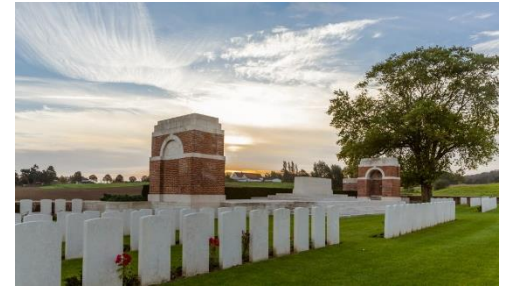
CWGC Larch Wood (Railway Cutting) Cemetery.

Deze begraafplaats is in april 1915 opgericht en vernoemd naar een nabijgelegen bosje lorken, meteen ook de reden waarom hier lorkenbomen zijn aangeplant. Larch Wood Cemetery telt 1.177 graven waarvan 321 niet geïdentificeerde. 82 militairen worden verondersteld hier begraven te zijn zonder dat ze een gekend graf hebben. Zij worden op de begraafplaats herdacht op wat men een Special Memorial noemt.