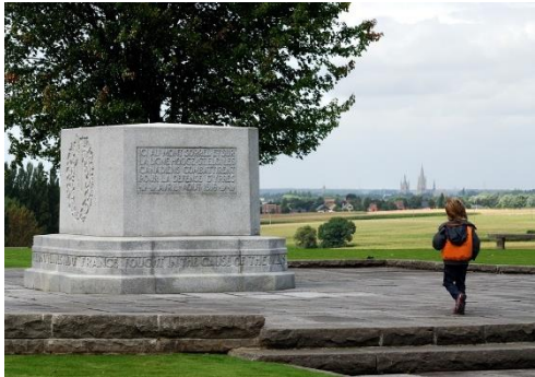
Hill 62 Canadian Memorial.

Op 6 juni lijken alle Duitse vuurmonden zich te concentreren op Hooge. Even later gaan bij het gehucht vier mijnen af. Ieper staat op het punt te vallen.