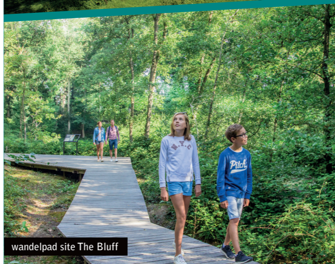
wandelpad site The Bluff