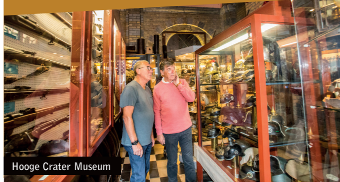
Hooge Crater Museum

Het Hooge Crater Museum zelf presenteert in aangrijpende scènes, foto's en films hoe het er tussen mei 1915 en september 1917 in deze omgeving aan toe ging.