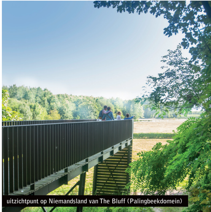
uitzichtpunt op Niemandslaan van The Bluff (Palingbeekdomein)

Honderd jaar na de grote wereldbrand blijft het oorlogslandschap de laatste getuige van het conflict. Daarom besteden het In Flanders Fields Museum en de stad Ieper bijzondere aandacht aan het landschap van de Ieperboog. Na de historische duiding in het museum en de visuele prikkel op de belfortoren, word je uitgenodigd om het oorlogslandschap zelf te beleven. Langs de Ieperboog werden drie instappunten ingericht van waaruit je de relictten van toen in het landschap van nu kan ontdekken. Deze instappunten zijn gratis toegankelijk en duiden aan de hand van een bijzondere film en infopanelen het verhaal van die bepaalde plek, meer dan 100 jaar geleden. Herdenkingsbomen langs de frontlijnen maken de Duitse en geallieerde Britse lijn opnieuw zichtbaar. En de uitgebreide digitale applicatie Ypres Salient 1914-1918 toont de sporen van het landschap vandaag op luchtfoto's van toen.