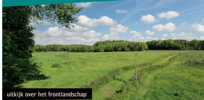
uitkijk over het frontlandschap

Vanuit het instappunt kijk je op het niemandslaan en de frontlijnen vanaf "The Bluff" tot het Molenbos. De in 2015 prachtig ontsloten site van The Bluff behoort tot de drie meest authentieke, perfect bewaard gebleven oorlogslandschappen rond Ieper. De wandeling leidt naar het meest bekende oorlogslandschap van de Ieperboog: Hill 60, met even verderop de unieke kratersite Caterpillar.