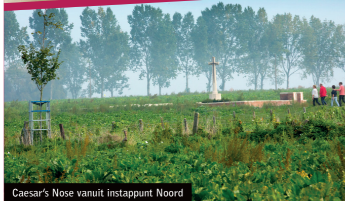
Caesar's Nose vanuit instappunt Noord