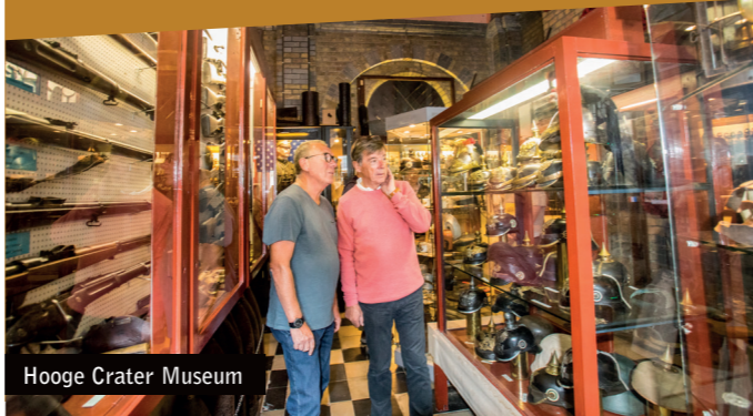
Hooge Crater Museum

Das Hooge Crater Museum veranschaulicht in ergreifenden Szenen, was sich in der Zeit zwischen Mai 1915 und September 1917 in diesem Bereich abspielte.