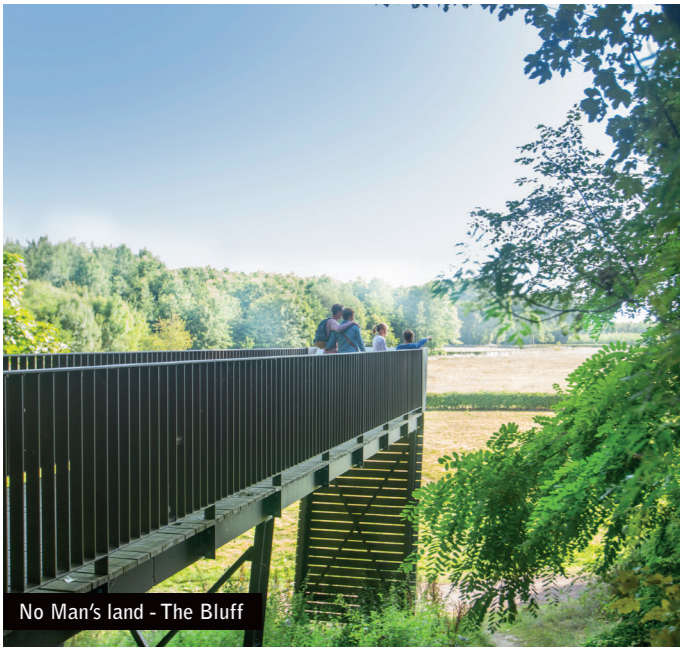
No Man's Land - The Bluff

Einhundert Jahre nach dem ‚Großen Krieg‘ ist die Kriegslandschaft der letzte Zeuge des Konflikts. Deshalb widmet das In Flanders Fields Museum der Landschaft des Ypernbogens besondere Aufmerksamkeit. Nach den historischen Erklärungen im Museum und dem reizvollen Blick vom Turm des Belforts werden Sie dazu eingeladen, die Kriegslandschaft selbst zu erleben. Entlang des Ypernbogens wurden drei Einstiegstellen eingerichtet, von denen Sie die Relikte von damals in der Landschaft von heute entdecken können. Diese Einstiegstellen sind kostenlos zugänglich und erzählen anhand eines besonderen Films und entsprechender Informationstafeln mehr als 100 Jahre später die Geschichte eines bestimmten Ortes. Gedenkbäume entlang der Frontlinie lassen die Linien der Deutschen und der Alliierten erneut sichtbar werden. Die umfangreiche digitale App Ypres Salient 1914-1918 zeigt die Spuren in der Landschaft von heute auf Luftaufnahmen von damals.