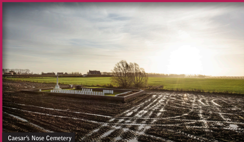
Caesar's Nose Cemetery

Het pad komt uit op een groot grasland dat je via een klappoortje binnenstapt. (Sluiten na gebruik!). Je wandelt even naar links.