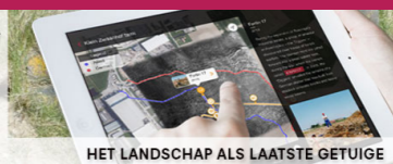
HET LANDSCHAP ALS LAATSTE GETUIGE