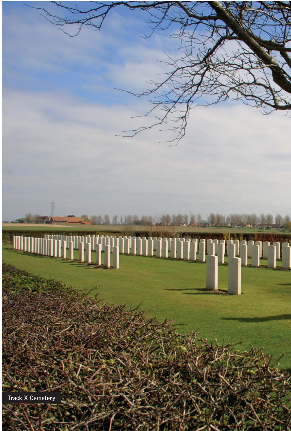
Track X Cemetery