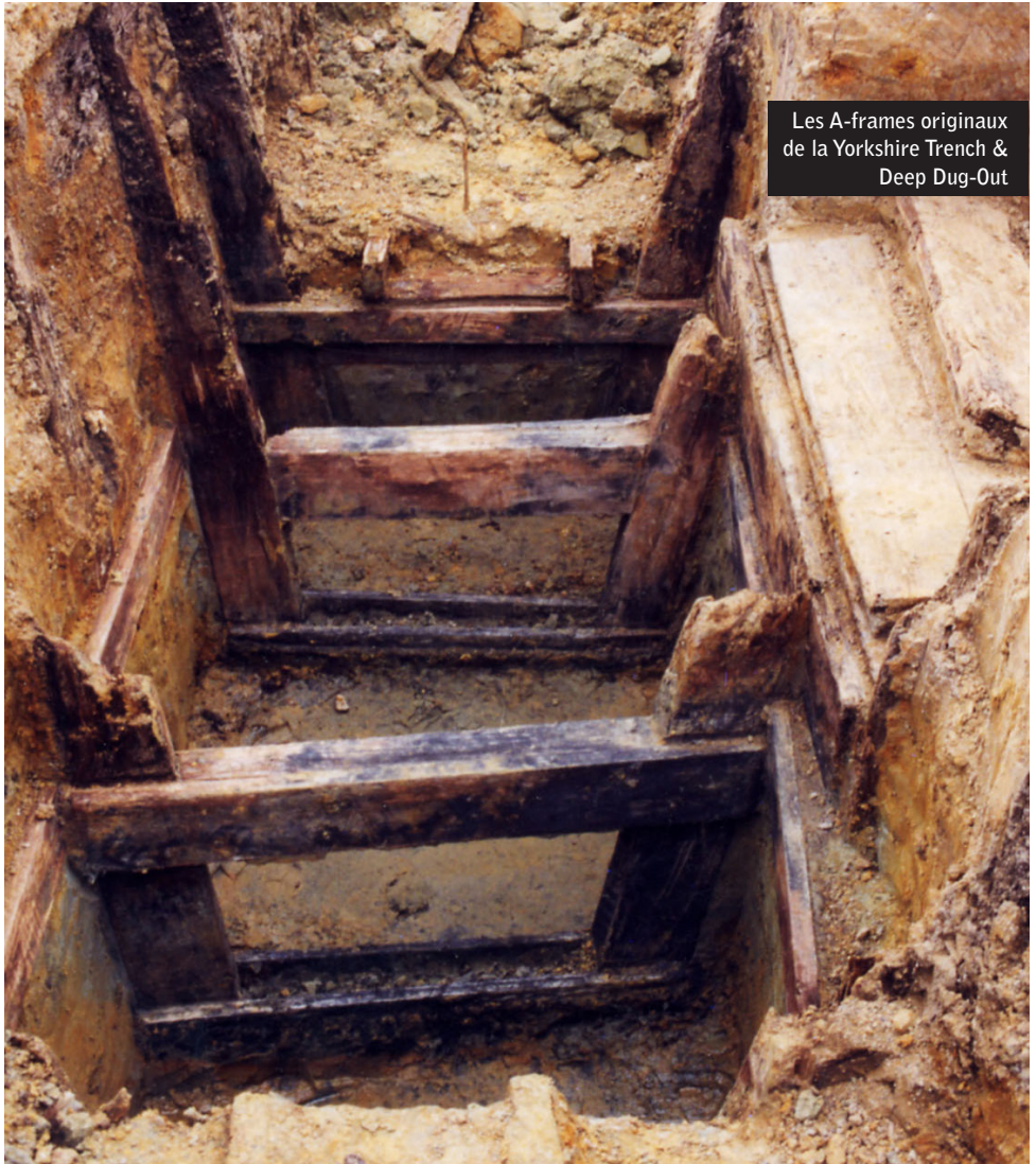
Les A-frames originaux de la Yorkshire Trench & Deep Dug-Out